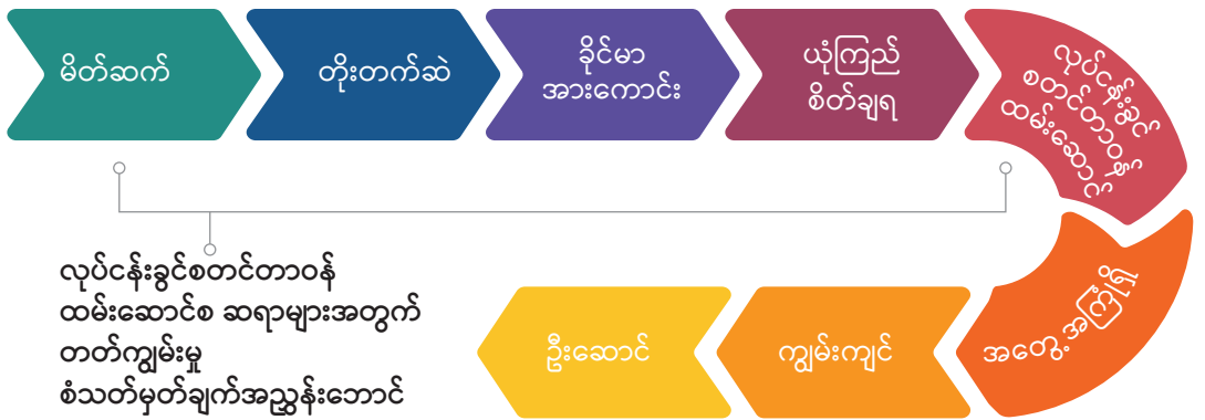
ပုံ ၁.၁။ ဆရာအတတ်ပညာဖွံ့ဖြိုးတိုးတက်ရေးတွင် တတိယနှစ် သင်ရိုးညွှန်းတမ်းရှိရာ နေရာ ၁

လက်တွေ့တန်းပြ လေ့ကျင့်ခြင်း အပိုင်း (၁၀) ၏ ရည်ရွယ်ချက်မှာ လက်တွေ့ပြန်လည် အသုံးပြုနိုင်သည့် အခြေအနေများတွင် စာသင်ခန်းအခြေပြု သင်ယူမှုကို အသုံးပြုနိုင်မည့် အခွင့်အလမ်းများကို ကျောင်းသားများအား ပံ့ပိုးပေးရန်ဖြစ်ပြီး ထိုမှတစ်ဆင့် ဆရာတစ်ဦး အဖြစ် ၎င်းတို့၏ မိမိကိုယ်ကို ယုံကြည်မှုနှင့် တတ်ကျွမ်းမှုများ တိုးတက်လာစေရန် ဖြစ်ပါသည်။ လက်တွေ့တန်းပြလေ့ကျင့်ခြင်း အတွေ့အကြုံများသည် ၎င်းတို့၏ ဆရာအတတ်သင် ပညာရေး စီမံကိန်းတွင် အကြမ်းဖျင်းဖော်ပြထားပြီး ပုံ (၁.၁) တွင် အလေးထားဖော်ပြထား သည့်အတိုင်း လိုအပ်သည့် တတ်ကျွမ်းမှုများကို ကျောင်းသားများက ဖွံ့ဖြိုးအောင် လုပ်ဆောင် နေကြောင်း အထောက်အထားပေးနိုင်မည့် နည်းလမ်းတစ်ခု ဖြစ်သည်။